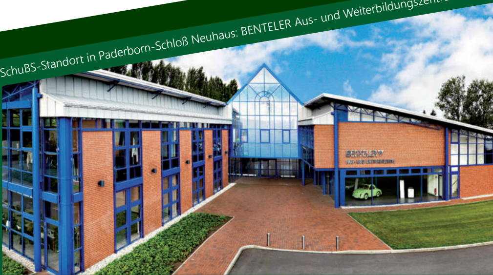
SchuBS-Standort in Paderborn-Schloß Neuhaus: BENTELER Aus- und Weiterbildungszentrum

SchuBS-Standort in Paderborn: Labors und Arbeitsräume der Fakultäten für Technikdidaktik und Elektrotechnik, Informatik und Mathematik der Universität Paderborn