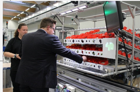
2016, Smart Factory OWL, Lemgo