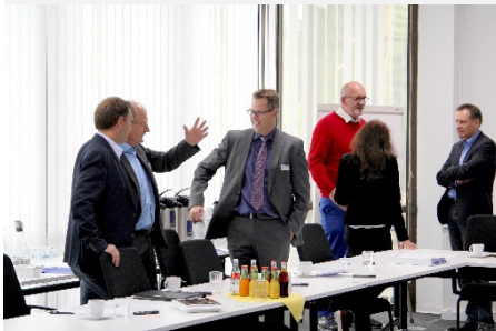
2019, Atos, Paderborn