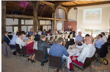
2018, Freilichtmuseum Detmold