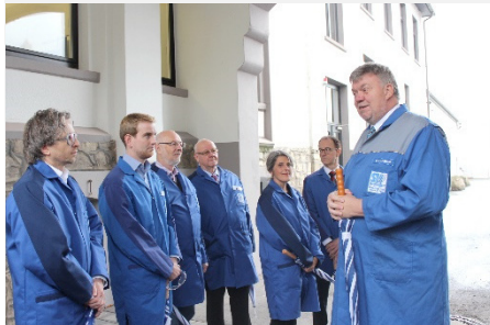
2017, Schwing und Hasse, Lügde