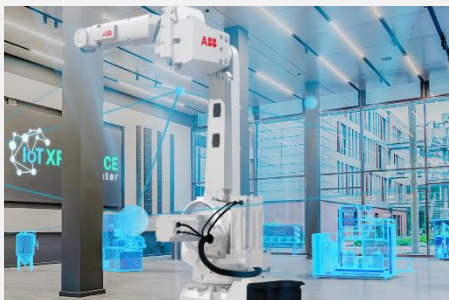
2023, IoT Xperience Center, Paderborn