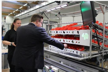
2016, Smart Factory OWL, Lemgo

Rückblick Mitgliederversammlungen 2016-2022