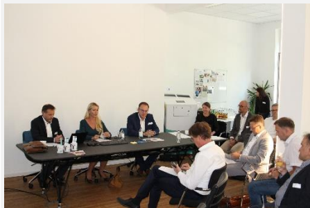
2022, insensiv, Bielefeld