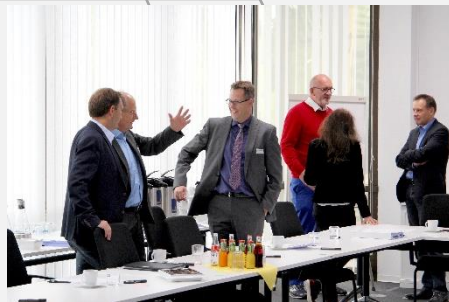
2019, Atos, Paderborn