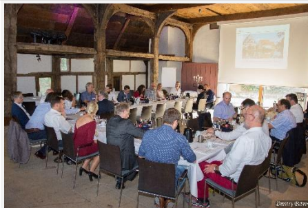
2018, Freilichtmuseum Detmold