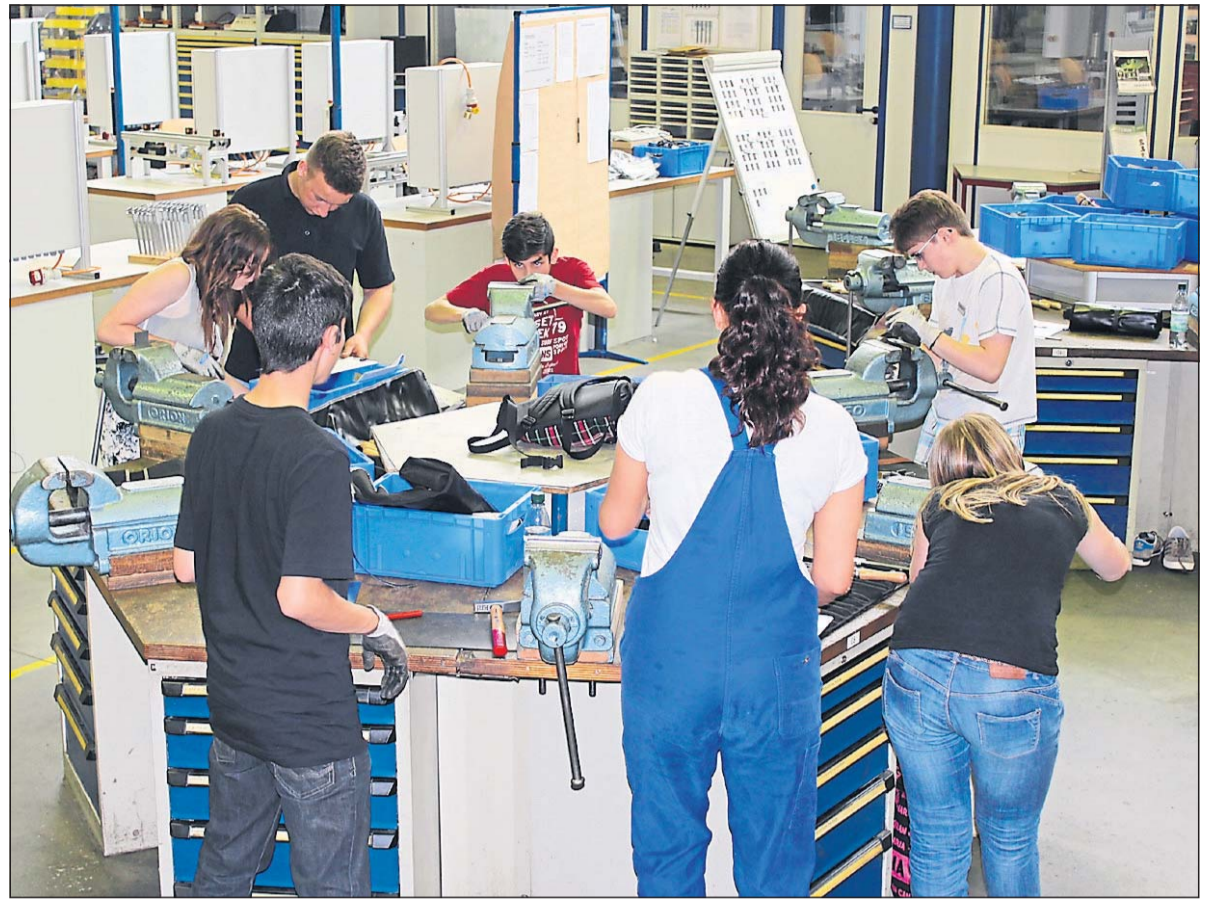
Schüler bei einem der »SchuBS«-Praxistage. Die Schüler lernen an 22 Wochenenden praxisnah das Berufsleben kennen. das Projekt ist nun für einen Preis nominiert worden.

Vorbereitungstreffen finden zu Jahresanfang statt am Mittwoch, 28. Januar, um 19 Uhr im Pfarrheim St. Joseph in Siegen-Weidenau und am Donnerstag, 29. Januar, um 19 Uhr im Gemeindezentrum St. Johannes in Hagen-Boele. Die zur Verfügung stehenden Plätze für die Hungertuchwallfahrer werden nach Eingang der Anmeldung vergeben. Diese nimmt entgegen das Dekanat Siegen, Häutebachweg 5 un 57072 Siegen, ☎ 0271/303710-10, Fax: 0271/303710-20, E-Mail: info@dekanat-siegen.de.